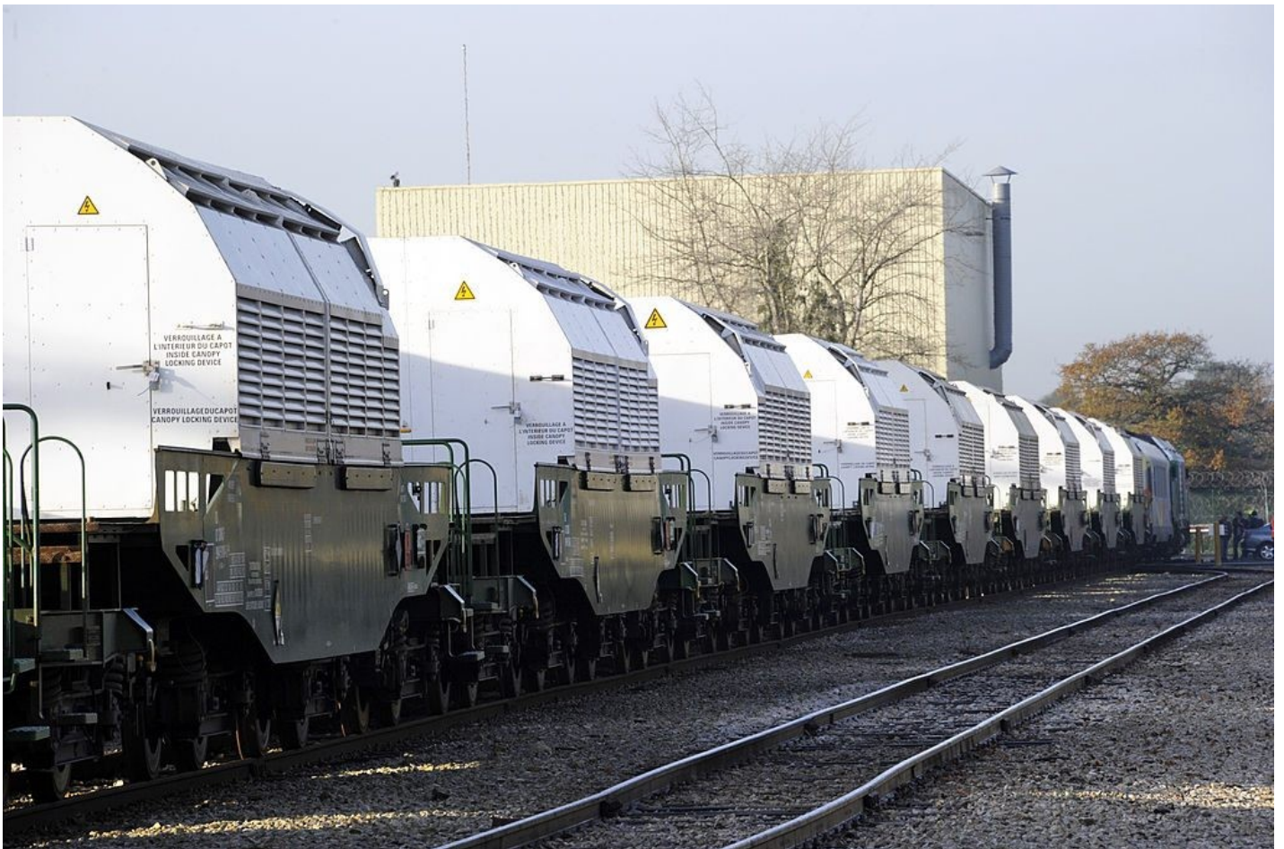
Ein Zug mit hochradioaktivem Abfall aus den Niederlanden nach Deutschland

Dieses Verfahren wurde nach dem so genannten « Scanzano-Desaster » eingeführt , bei dem die Regierung im Jahr 2003 eine Kehrtwende vollzog, nachdem sie mit großem Tamtam verkündet hatte, den Standort für das nationale Endlager gefunden zu haben. « Im November 2003 beschloss die Regierung durch ein Gesetzesdekret, das Endlager für alle Abfallkategorien in der Stadt Scanzano Jonico in der Provinz Matera anzusiedeln », schreibt Piero Risoluti, einer der führenden italienischen Experten für radioaktive Stoffe.