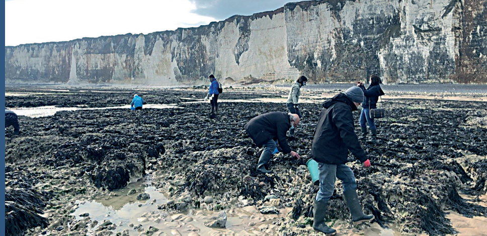
Prélèvements citoyens réalisés par l'ACRO

EDF ! C'est donc le responsable de la pollution qui est censé réaliser lui-même des analyses de cette même pollution... Ce système contrôleur/contrôlé soulève une question de conflit d'intérêt.