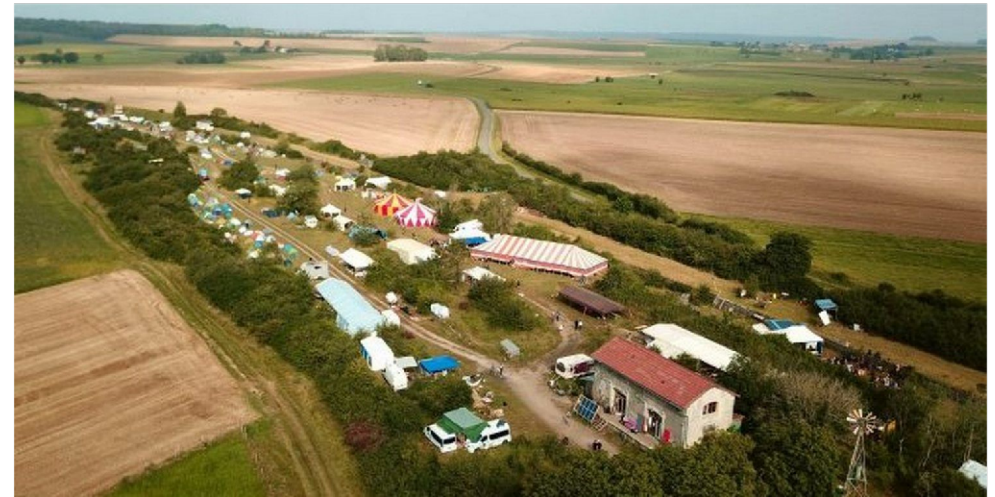
La gare vue du ciel durant les Rayonnantes (Août 2021)

La Gare est actuellement gérée par une association légale, et en parallèle, en autogestion par un collectif d'habitant·es. Les décisions y sont prises en assemblée de personnes plus ou moins proches géographiquement, mais toutes déterminées à la faire perdurer en tant qu'outil pour la lutte contre l'ANDRA et comme lieu vivant et émancipateur dans le sud-meusien.